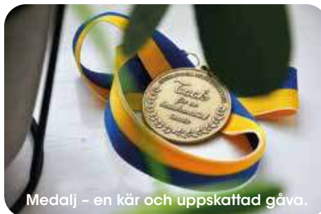
Medalj - en kär och uppskattad gåva.

Kom gärna med synpunkter och förslag så hjälper vi dig att göra verklighet av dina idéer och önskemål.