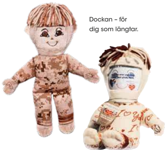
Dockan - för dig som längtar.